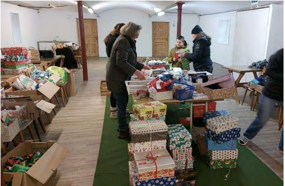
Foto zeigt emsiges Kontrollieren und Versiegeln der gespendeten Päckchen

Lieber Herr Jesus, wir danken dir für jeden einzelnen Schuhkarton, den wir diese Woche zusammenpacken durften. Danke, dass alles prima geklappt hat. Wir vertrauen auf dich, dass nicht nur das Materielle bei den Kindern ankommt, sondern auch die Botschaft deiner Liebe. Das wahre Weihnachtswunder, dass du auf die Welt kamst, um unser Retter zu werden. Bitte segne die weitere Reise der Päckchen und die Empfänger. Amen.